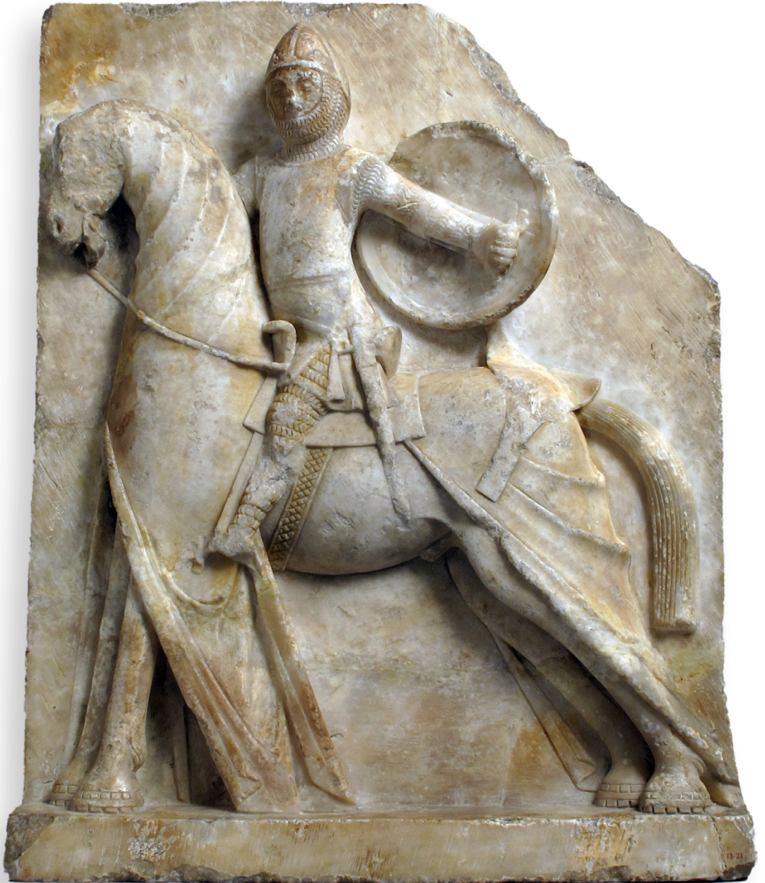
Altorelievo su pannello di alabastro, Spagna, XIII secolo, Metropolitan Museum, Fondo Dodge 1913. Public Domain.