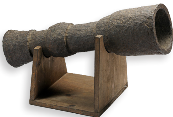
Bombardella in ferro fucinato, Italia centro-settentrionale, fine XIV secolo. Brescia, Museo delle armi "Luigi Marzoli", inv. 101.