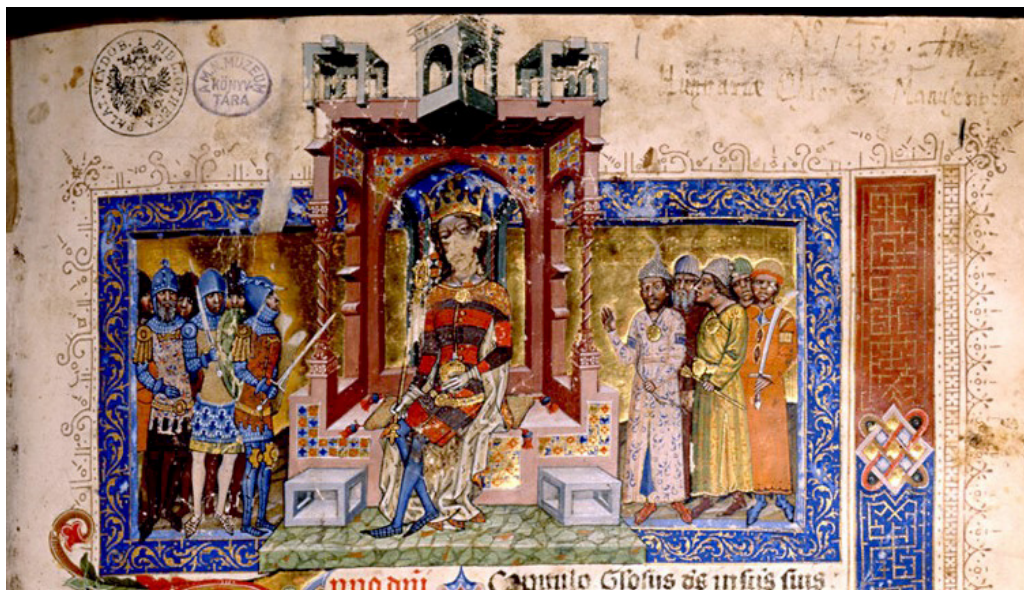
Fig. 5. Chronicon Pictum , Budapest, Országos Széchényi Könyvtár, Clmae 404, c. 2r, Luigi I assiso in trono circondato dai notabili del regno (particolare)