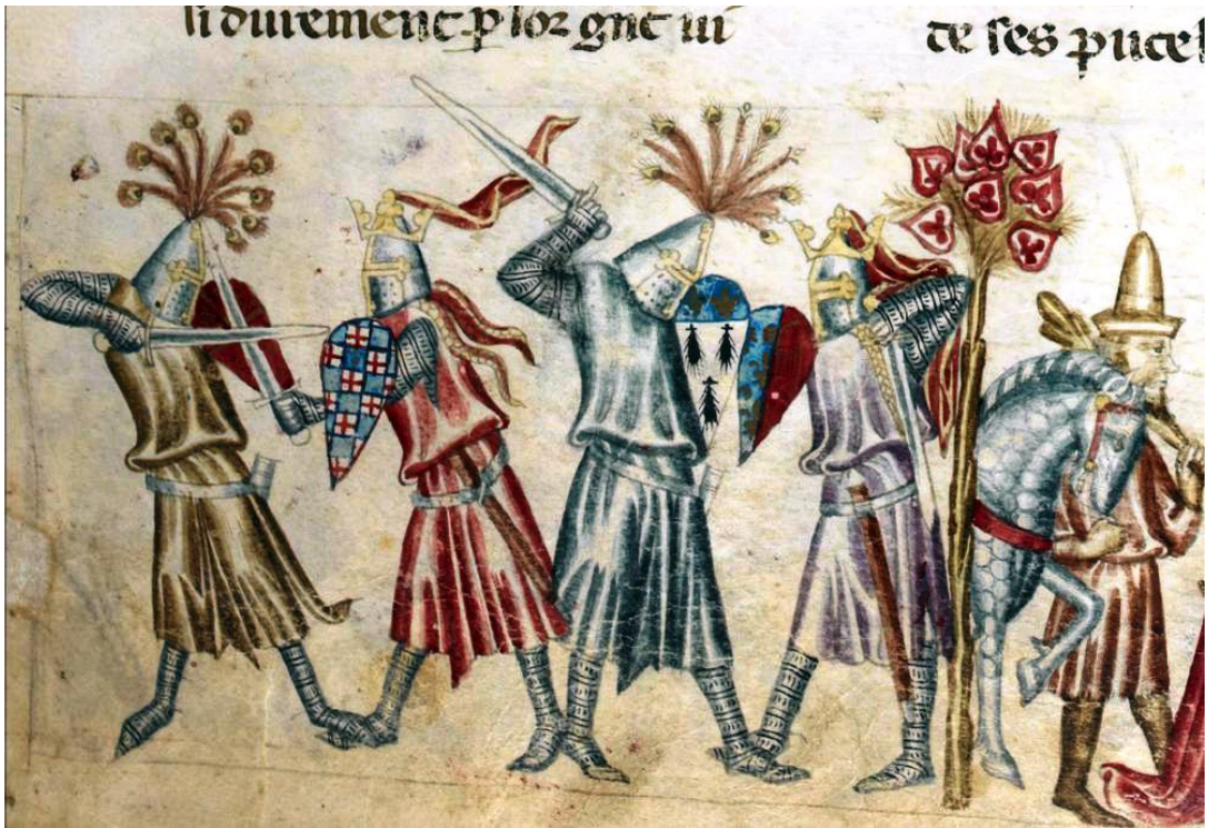
Fig. 4. Histoire ancienne jusq'à a César , British Library, BL Royal 20 D I, 025r

di conflitto. In questo contesto, lo chapel de fer risulterebbe essere in assoluto la migliore protezione per il capo per un combattente italiano, poiché il coppo proteggeva il cranio come un qualsiasi altro elmo, ma, a differenza di barbute e bacineti, le falde di metallo assicuravano copertura anche dagli oggetti scagliati dall'alto, garantendo, altresì, una ottimale percezione uditiva e visiva del campo di battaglia 33 .