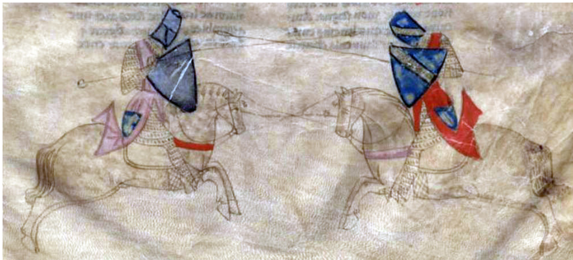
Fig. 1. Partie du roman en prose de Lancelot du lac Parigi, Bibliothèque nationale de France, Ms. Fr. 16998, c 51r

Le Roman de Tristan (fig. 2), realizzato in Lombardia tra il 1320 ed il 1330, può essere visto invece come un codice “di passaggio” poiché in esso i cavalieri raffigurati indossano sia degli “obsoleti” usberghi sia delle “moderne” coat of plates. Gli arti e le spalle sono coperti da protezioni rigide in corame o in metallo e, a salvaguardia del capo, alcuni cavalieri calzano bacinetti con visiere a ribalta apribile verso l’alto, mentre altri la barbute, lo chapel de fer o perfino il pentolare con coppo ad ogiva 31 .