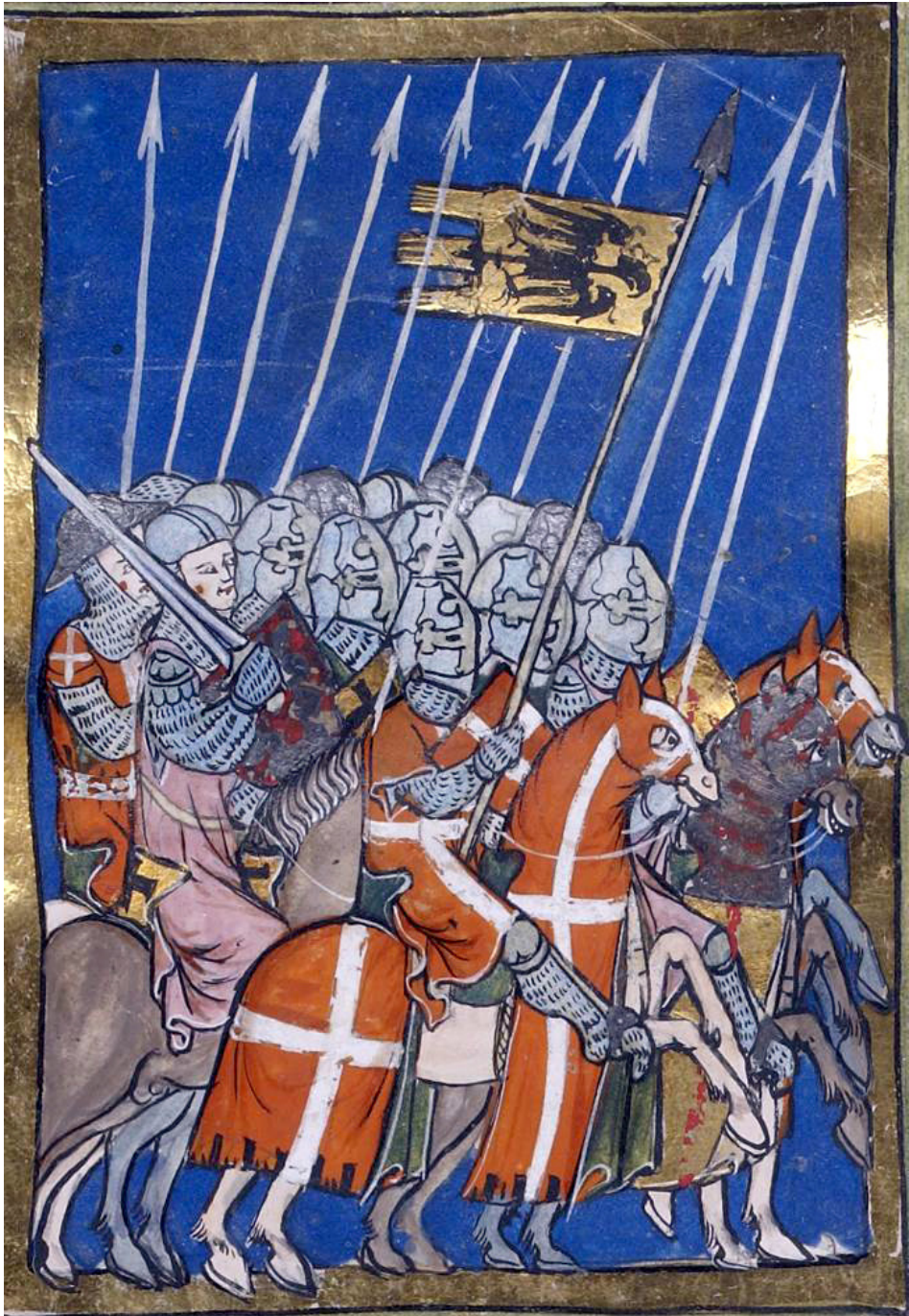
Fig. 3. Faits des Romains , Parigi, Bibliothèque Nationale de France, fr. 295, c. 50