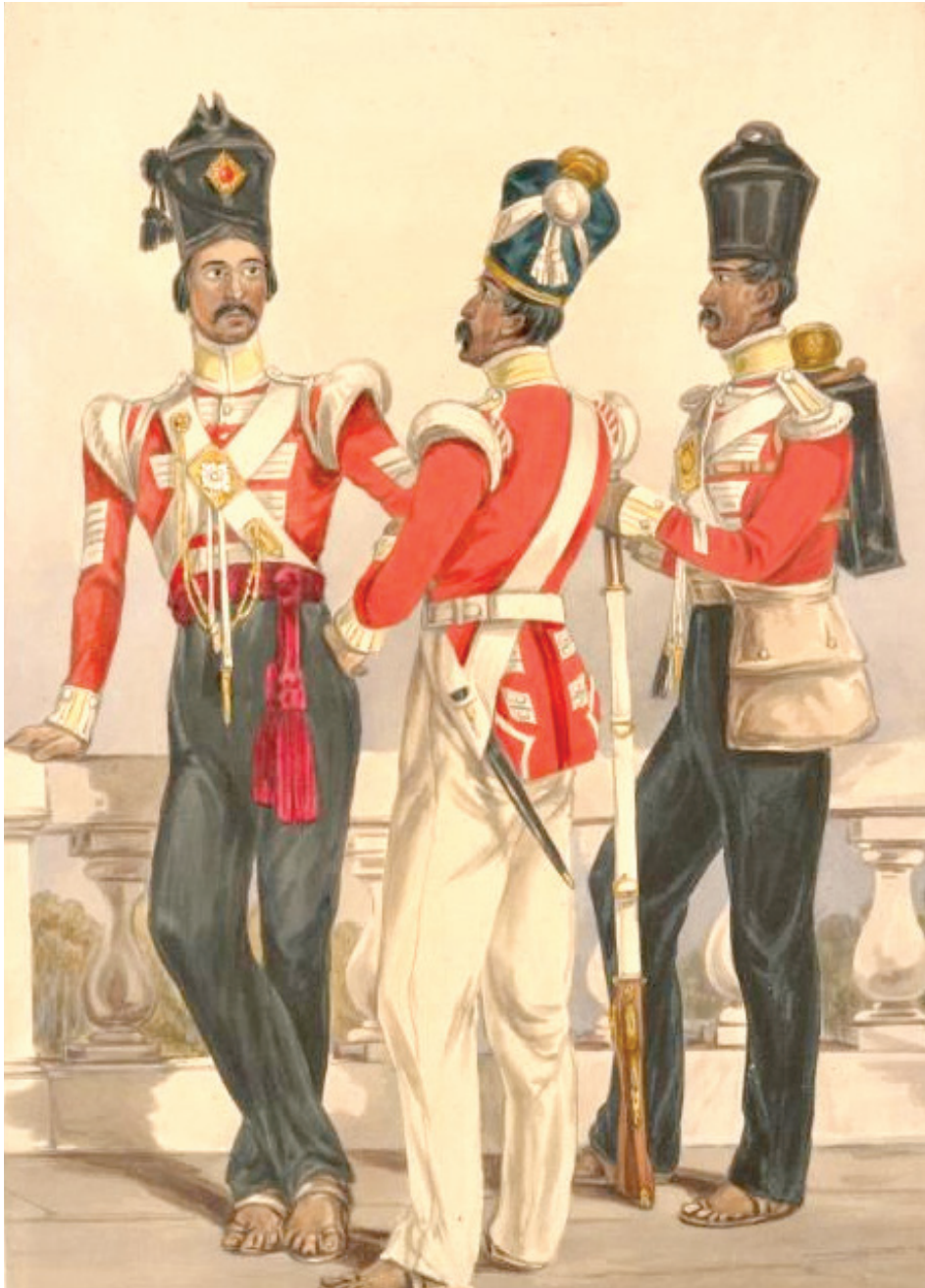
Madras Infantry, 32 nd Regiment