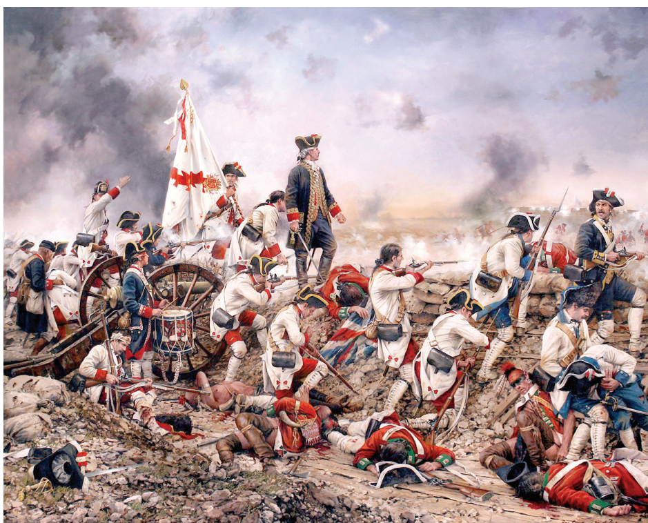
Augusto Ferrer-Dalmau, Por España y por el rey, Gálvez en America (Battaglia di Pensacola) . Opera creata in Creative Commons Attribution-Share Alike 4.0 International license wikimedia commons.