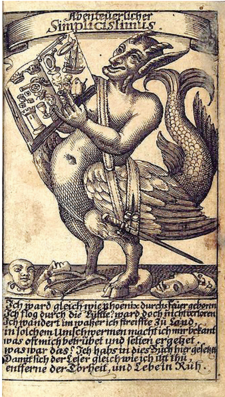
Hans Jacob Christoffel von Grimmelshausen, Frontispizio di Abenteuerlicher Simplificissimus 1669.