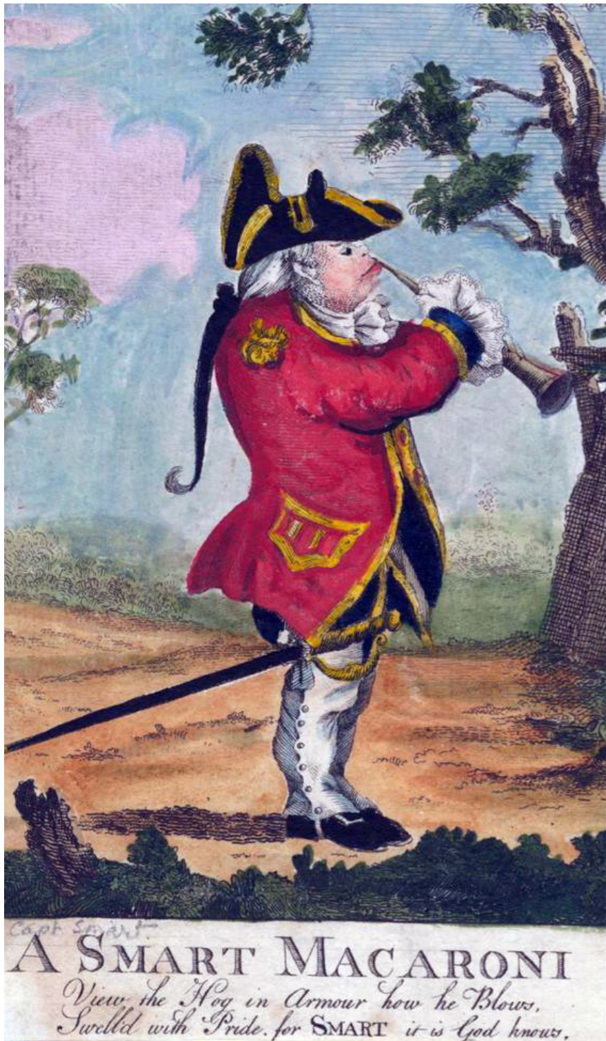
A Smart Macaroni, Caricature from "Martial Macaroni", in Anne S. K. Brown Military Collection. (see West, «The Darly Macaroni Prints and the Politics of "Private Man.»», Eighteenth-Century Life , 25.2 [2001], pp.170-1.